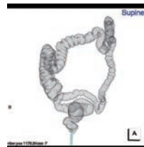
【大腸CT VR像:大腸全体を観察します】

平坦な病変や5mm以下の小病変は検出されにくい点があげられます。ただし、一般的に治療が必要とされる6mm以上の病変の多くは診断できます。ただ、細胞の検査やポリプ切除などの治療をすることはできません。病変があった場合は、後日カメラによる検査や治療が必要になることがあります。またCT撮影に伴い、最低限で安全な範囲の医療被曝があります。ただ、被曝量は注腸検査より少なく、大腸がんを見つけるメリットと比べると問題は少ないとされています。