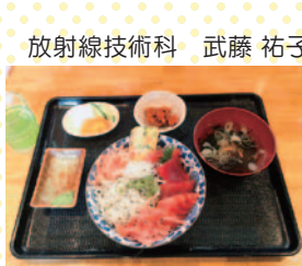
放射線技術科 武藤 祐子