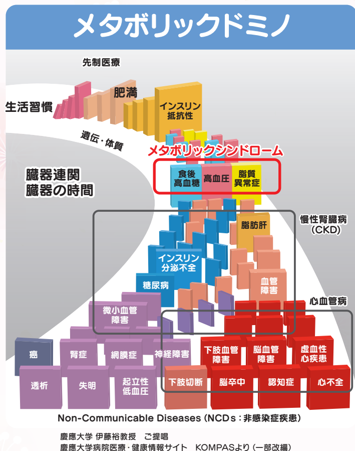
図2 メタボリックドミノの概念図

とはいえ「 肥満 」はメタボリックドミノ(図2)の上流にあるともいわれており、 放置 すると治療の必要な「 肥満症 」、「 メタボリック症候群 」やその他の様々な疾患へドミノ倒しのように進んでいく可能性もあります。「 肥満 」や「 肥満症 」、「 メタボリック症候群 」に対して、適切な介入や治療を行うことで、併せ持つ健康障害の改善やその後に続く健康障害の予防にもなると考えられています。