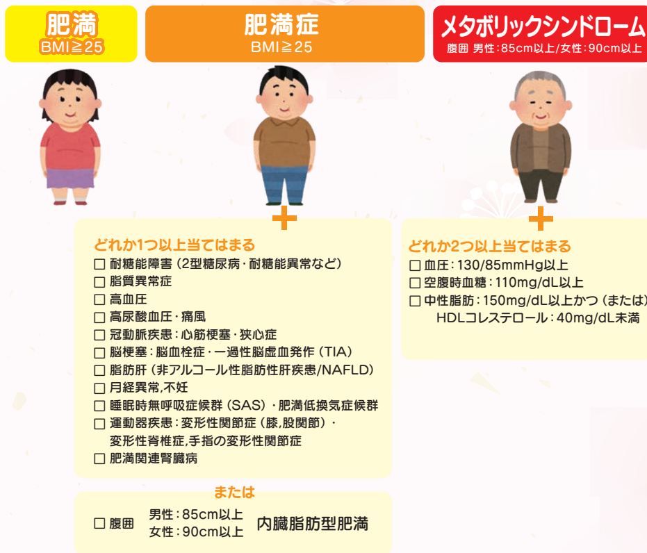
図1 「肥満」と「肥満症」と「メタボリックシンドローム」

BMI (体格指数=体重[kg]/身長[cm] 2 ) ≥ 25の状態を「 肥満 」といいます。「 肥満 」は単純に体重が身長に対して多い状態であるということ、いわゆる病気ではありません。その一方で、 肥満 によって生じる、または 肥満 に関連する健康障害がある場合、あるいは 内臓脂肪 の蓄積によってそれらの健康障害が起こりやすい場合に、「 肥満症 」と診断され、ひとつの疾患として扱われます。 内臓脂肪 の多い状態には「 メタボリック症候群 」もあります。(図1)