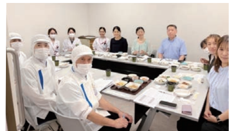
名古屋掖済会病院への見学