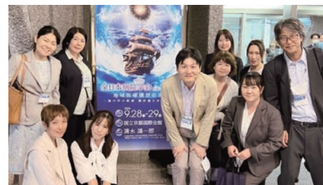
全日本病院学会に参加