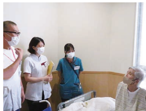
※患者さまと職員に許可を得て掲載しております。

これらのNST活動を通じて、入院患者さまの栄養管理に目を配り、入院の原因となった疾病の治療効果に少しでも寄与出来るよう尽力してまいります。