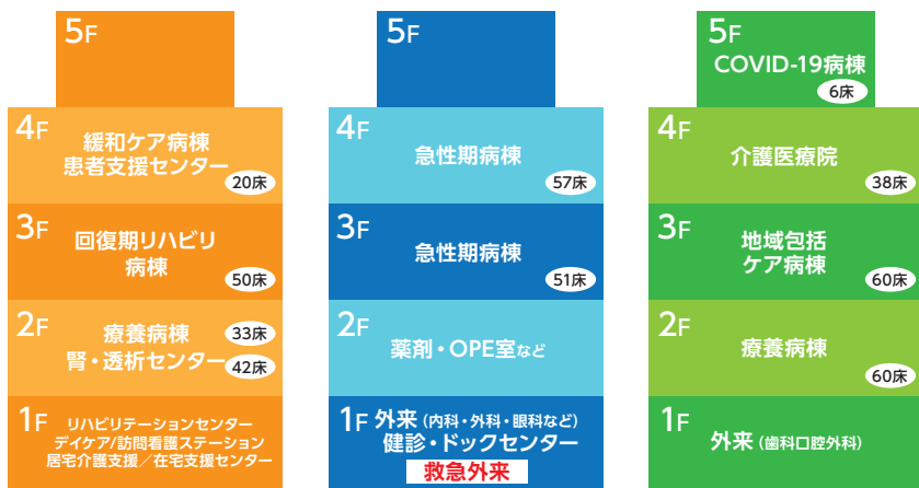
東館(旧南館) East building