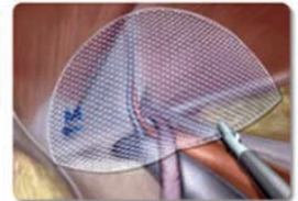
補強用メッシュ留置画像