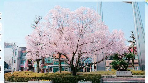
名鉄犬山線岩倉駅西側ロータリー