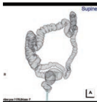
【大腸CT VR像:大腸全体を観察します】

平坦な病変や5mm以下の小病変は検出されにくい点があげられます。ただし、一般的に治療が必要とされる6mm以上の病変の多くは診断できます。ただ、細胞の検査やポリプ切除などの治療をすることはできません。病変があった場合は、後日カメラによる検査や治療が必要になることがあります。またCT撮影に伴い、最低限で安全な範囲の医療被曝があります。ただ、被曝量は注腸検査より少なく、大腸がんを見つけるメリットと比べると問題は少ないとされています。