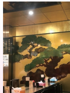
【「金ピカ」な店内の壁】