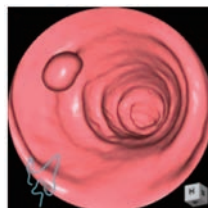
【大腸CT VE像と内視鏡像の比較:CTで得られた画像データを再構築し仮想内視鏡画像を作ります。実際の内視鏡検査画像に極めて近い像が得られます。】

どの検査にも一長一短がありますが、今までは「大変に辛い」と言われることの多かった大腸検査の選択肢として、従来よりも苦痛の少ない検査法が一つ増えたことによる喜んでいただける患者さんがおられ、病診連携でもご紹介をいただく機会が増えてきています。検診の二次検査や、おなかの調子が悪いなどで大腸検査を希望される方は、消化器内科医師へご相談ください。